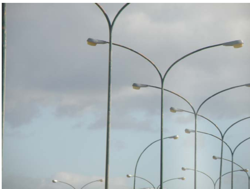
Foto n. 20 - Pali di illuminazione