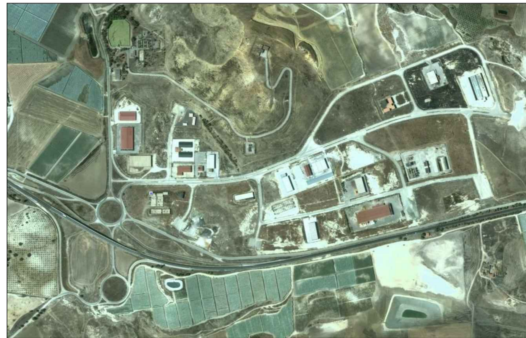
ORTOFOTO DELL'A.I. DI RAVANUSA - AREA DEL SALSO